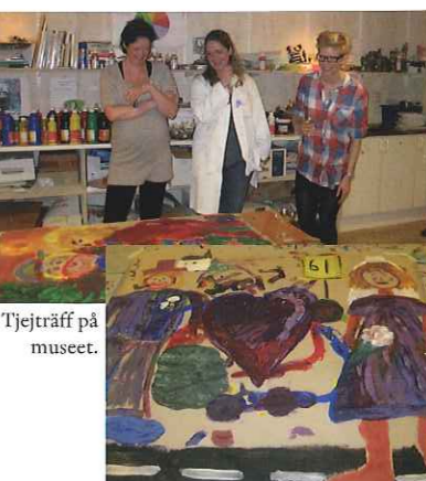
Tjejräff på museet.

Fira födelsedagen, släkträffen, möhippan, kick-offen, styrelsemötet osv... med att måla tillsammans! Vi lovar mycket färg och många skratt! Avgift 250:-/pers. inkluderar material, visning av utställningarna. Önskemål om mat och dryck tillkommer.